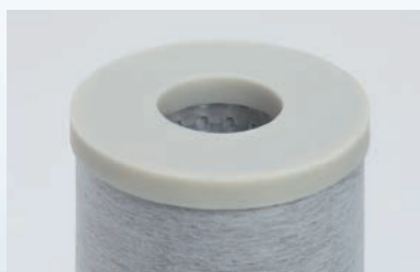
通常品(ダブルオープンエンド)

通常品のダブルオープンエンドの他、Oリング(222、226)のフィン有、無もご用意しております。